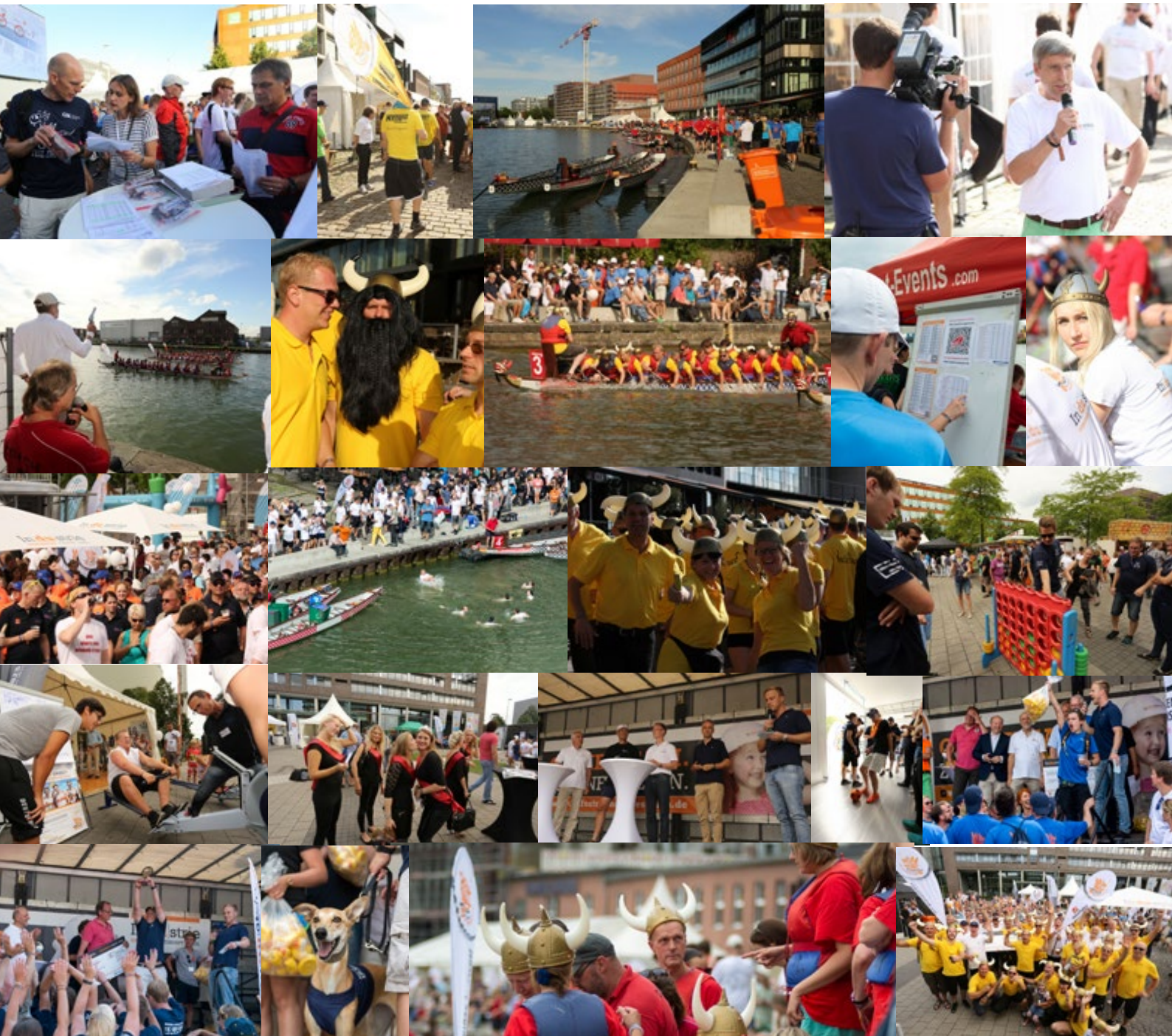
Stimmen der Teilnehmer