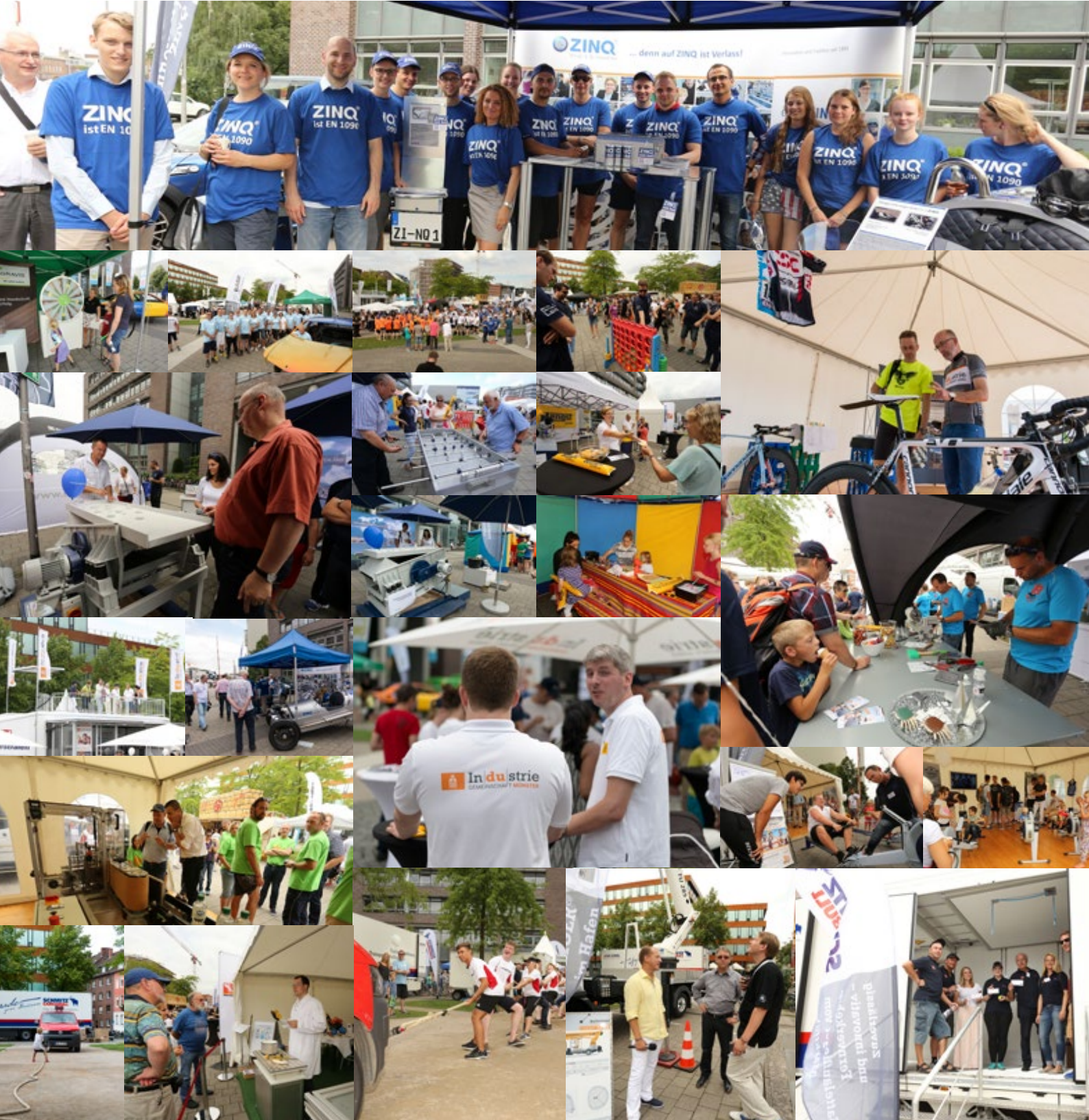
Stimmen der Teilnehmer