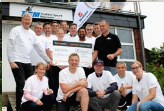
Stimmen der Teilnehmer

„Firmen und deren Mitarbeiter waren begeistert.“