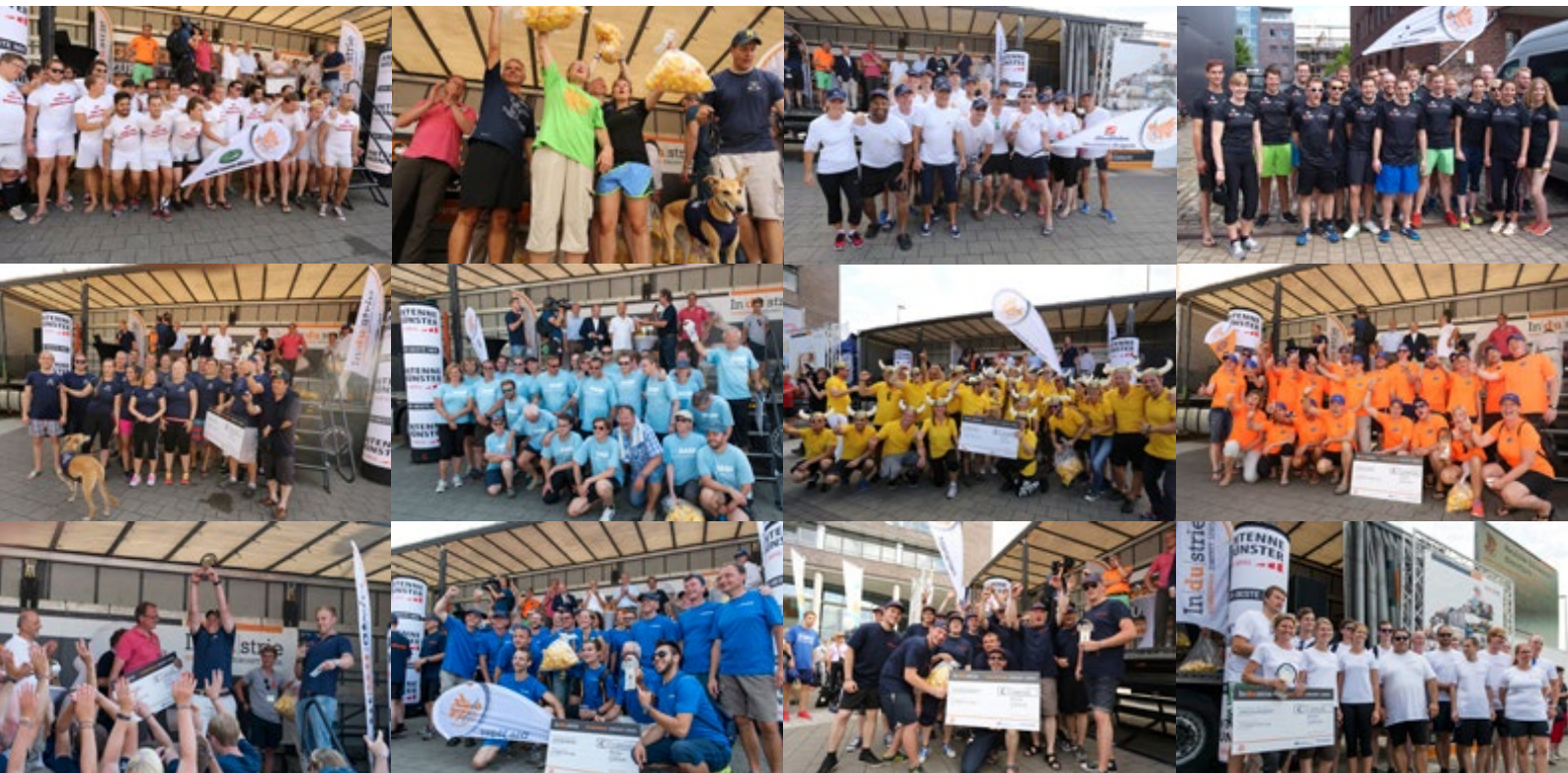
Stimmen der Teilnehmer