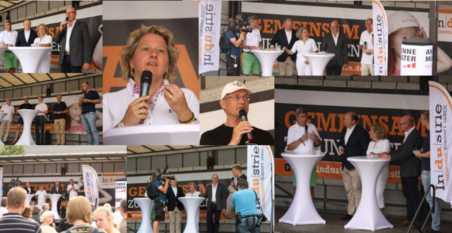
Stimmen der Teilnehmer

„Wir sind beim nächsten Mal auf jeden Fall wieder mit dabei!“