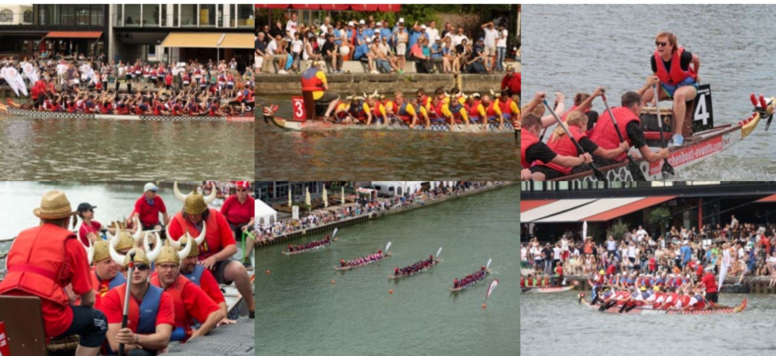
Stimmen der Teilnehmer