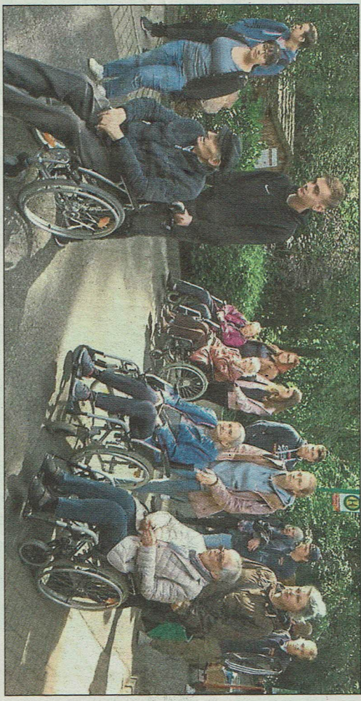
Einen Ausflug in den Tierpark nach Hamm konnten 25 Senioren Dank der Hilfe von 25 Auszubildenden der Beckumer Industrie unternehmen.